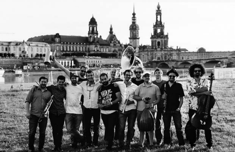
↑ S. 62: BANDA COMUNALE

14 – 16 Uhr Stadt- rundgang Treffpunkt wird nach Anmeldung per Mail bekannt gegeben