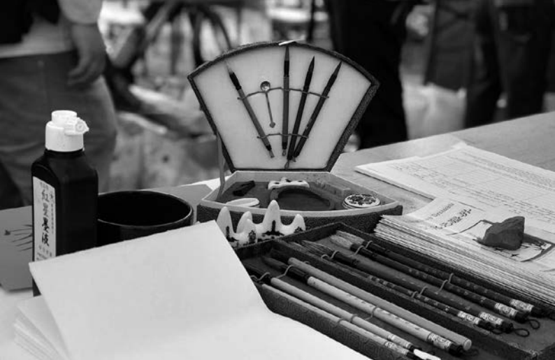
↑ S. 10: Traditionelle chinesische Kalligrafie