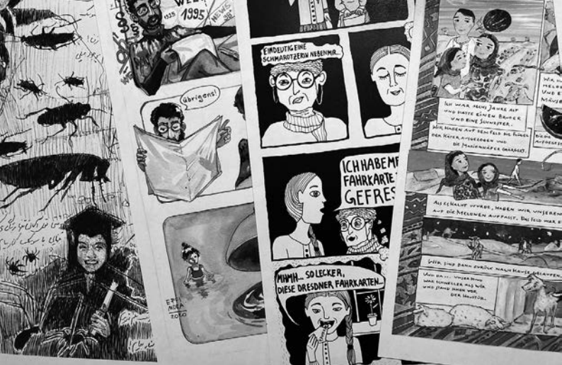
↑ S. 54: Ein wissenschaftlicher Blick auf biografische Comic-Zeichnungen