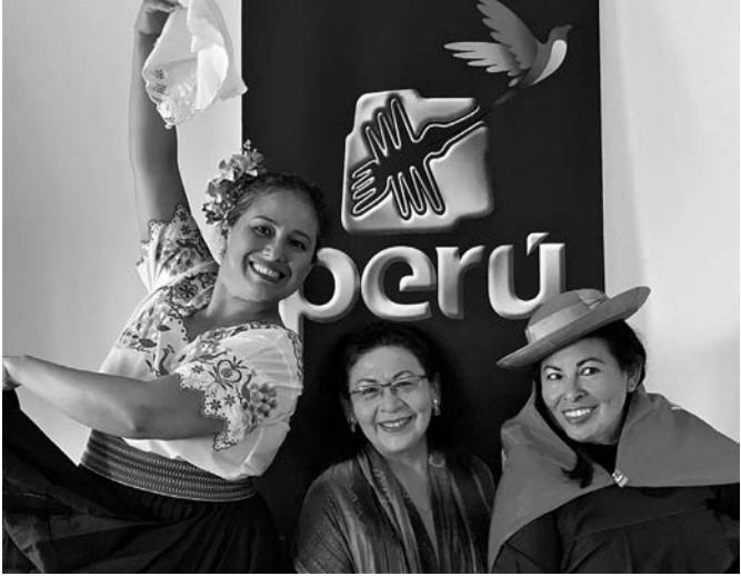
Wanderinnen zwischen den Welten | Foto: Irma Castillo