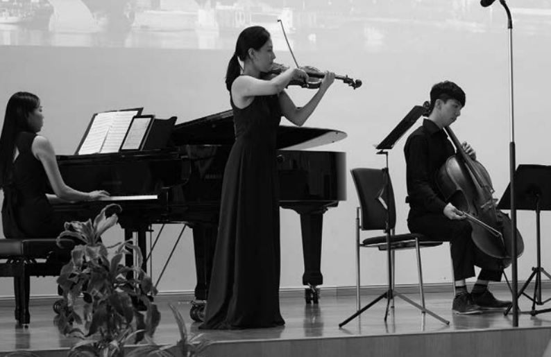
Friedensfest der Kinder Abrahams