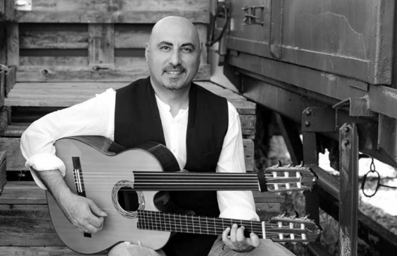
Die Musik Armeniens