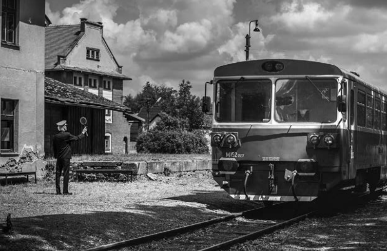
↑ S. 44: Film „Ausnahmesituation“