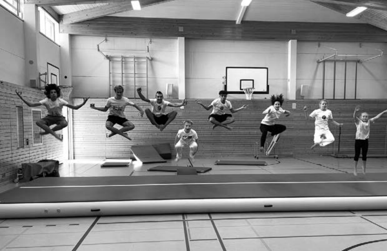
Akrobatik – Bewegungen ohne Grenzen