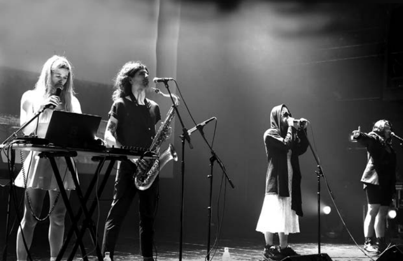
PUSSY RIOT auf ihrer aktuellen Tour