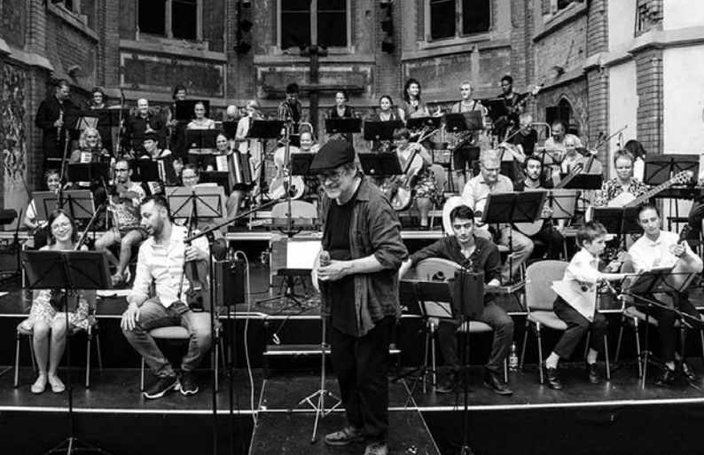
KlangBRÜCKEN zum Frieden