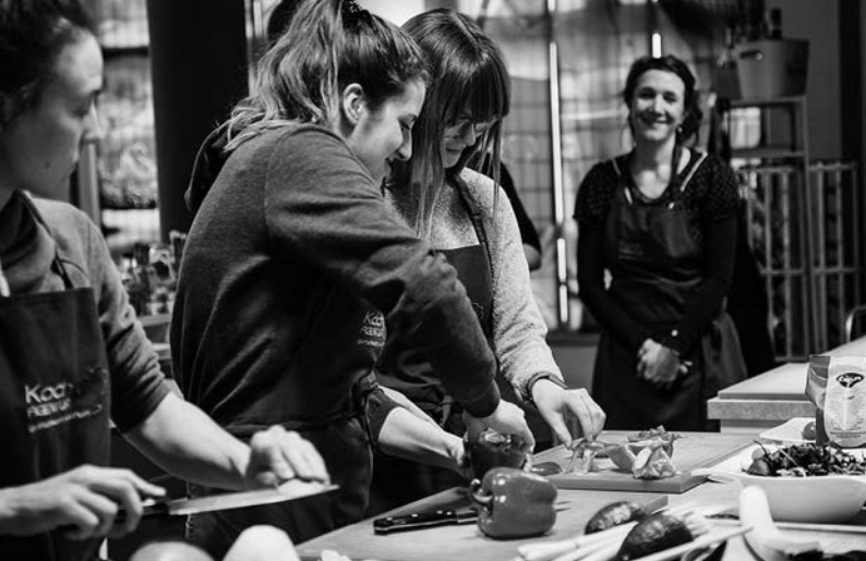
Küfa-Schnippeldisko – Essen verbindet | Foto: BUND Dresden | blende auf