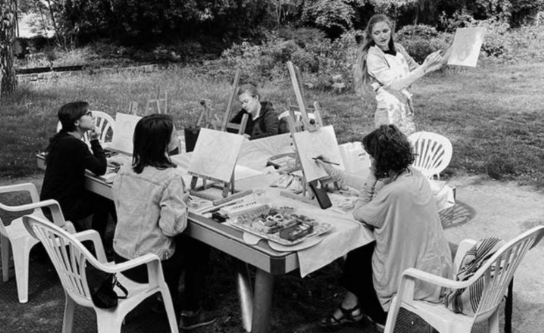
Malworkshop im Grünen