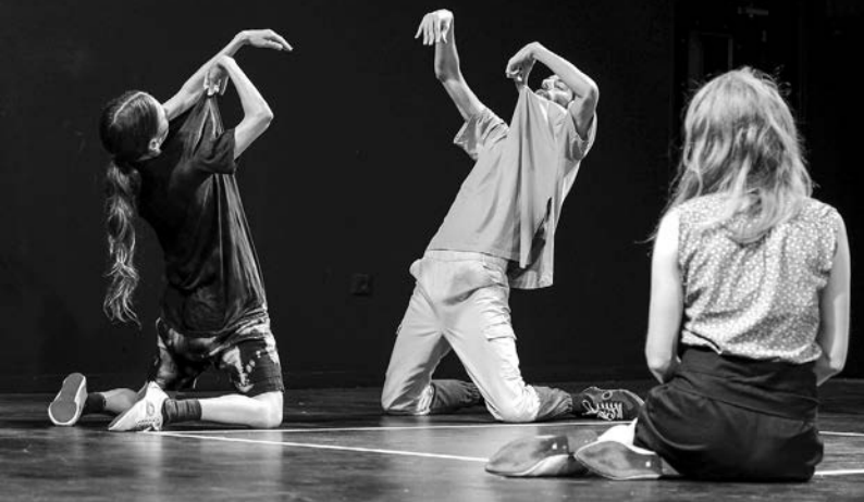
Yasmeen Godder „Practicing Empathy“